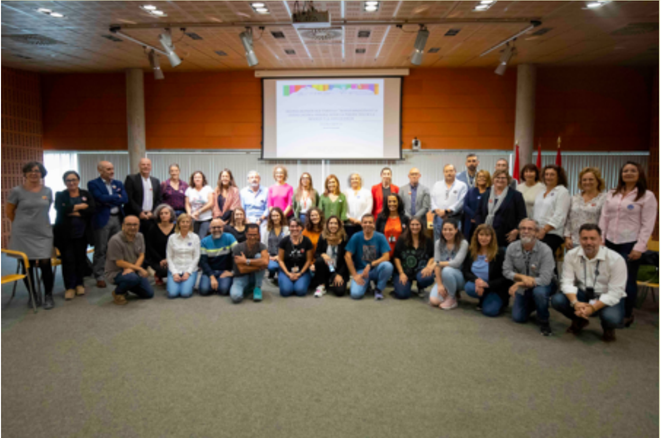
Reunión de la Red Temática en Rivas Vaciamadrid los días 20 y 21 de octubre de 2022.