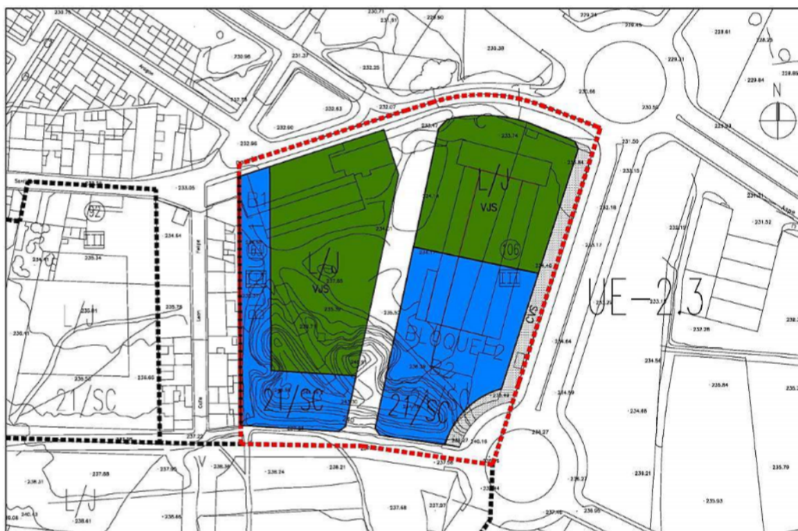
Imagen 2. Propuesta de modificación del ámbito de la UE 2.3. Plano 2-1.2

a) Número de plantas: La altura de la edificación, en número de plantas incluida la planta baja, será la establecida gráficamente en el plano 2-1.2. Plano modificado.