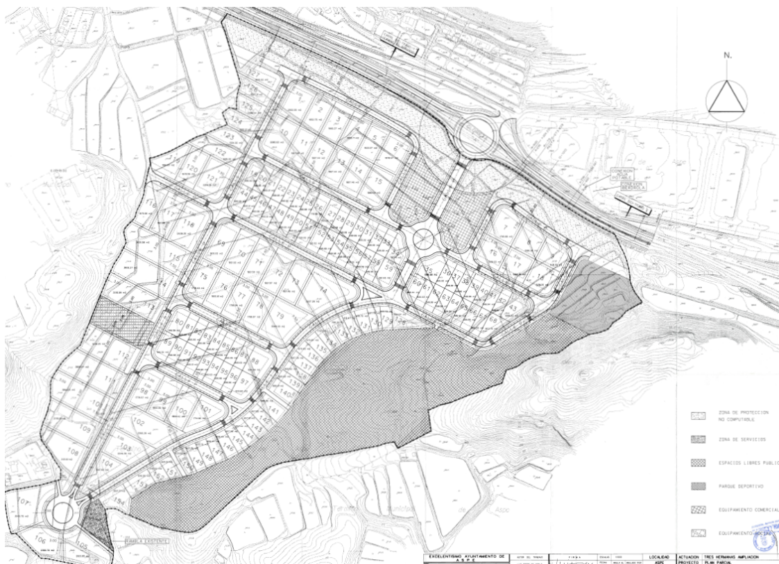
Plano parcelario del Polígono Industrial Tres Hermanas II (Plan Parcial "Tres Hermanas Ampliación")

El objeto de la presente modificación puntual es el de incrementar los usos establecidos para los Polígonos Industriales Tres Hermanas I y Tres Hermanas II a fin de posibilitar, en la mayor medida posible, la implantación de usos compatibles con el uso industrial actual, siempre sin sobrepasar el límite del 50% de uso Industrial (Uso Característico de ambos polígonos).