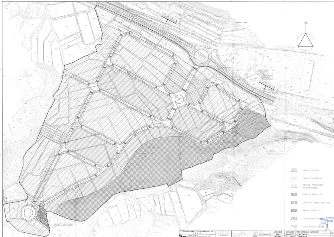
Plano de zonificación del Polígono Industrial Tres Hermanas II (Plan Parcial “Tres Hermanas Ampliación”)