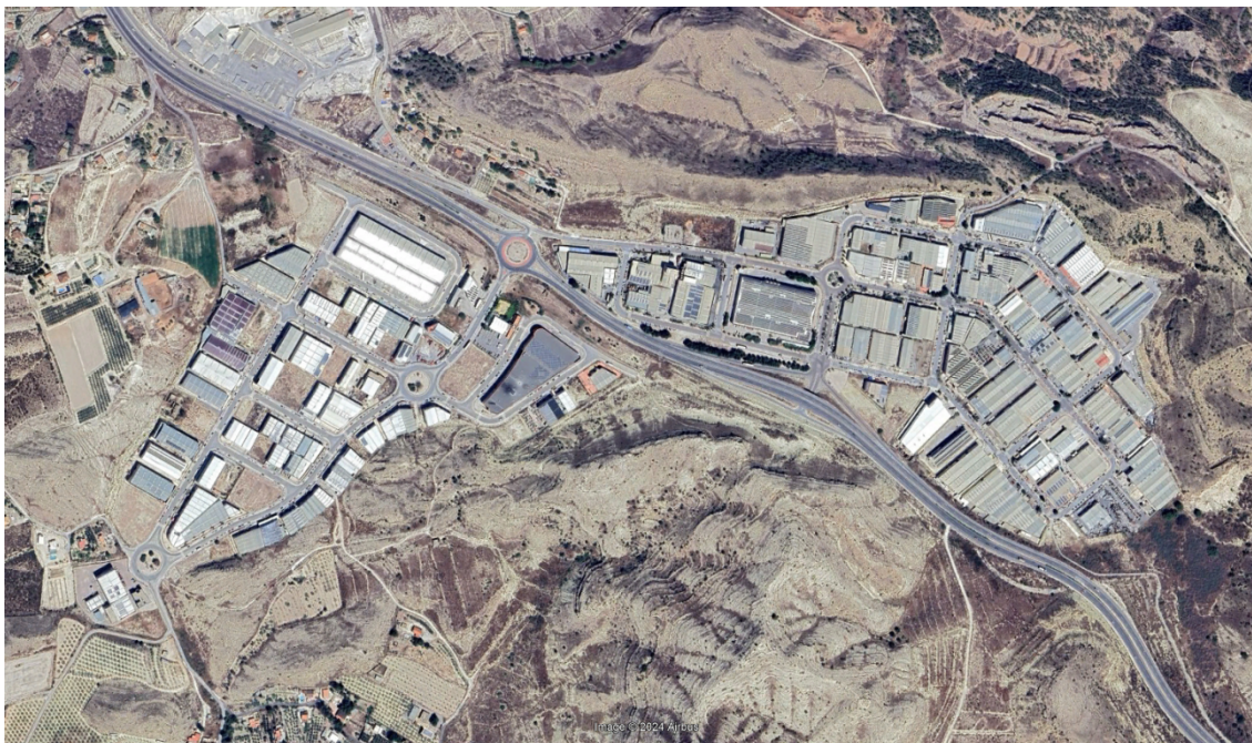
Imagen aérea de los polígonos industriales Tres Hermanas I y II.

El ámbito de la modificación propuesta, ambos polígonos, está prácticamente colmatado por la edificación, quedando algo de suelo vacante aun en el Tres Hermanas II. No se considera necesario realizar un inventario de las edificaciones existentes al tratarse a día de hoy ya de suelo urbano consolidado por la edificación.