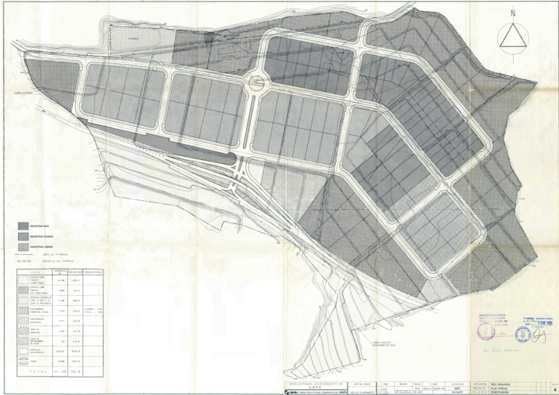
Plano de zonificación del Polígono Industrial Tres Hermanas I (Plan Parcial "Tres Hermanas")

A continuación, en los planos de zonificación de los planes parciales Tres Hermanas y Tres Hermanas Ampliación se puede observar las diferentes zonas en que se dividen los citados sectores.